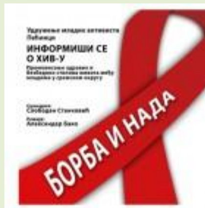
Ученици IV2 су заједно са професорком Славицом Стошић радили пано на тему :Како се заштитити од ХИВ-а