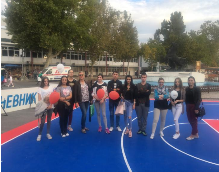
7.10.2017. Једнодневни излет професора у Андрић град.